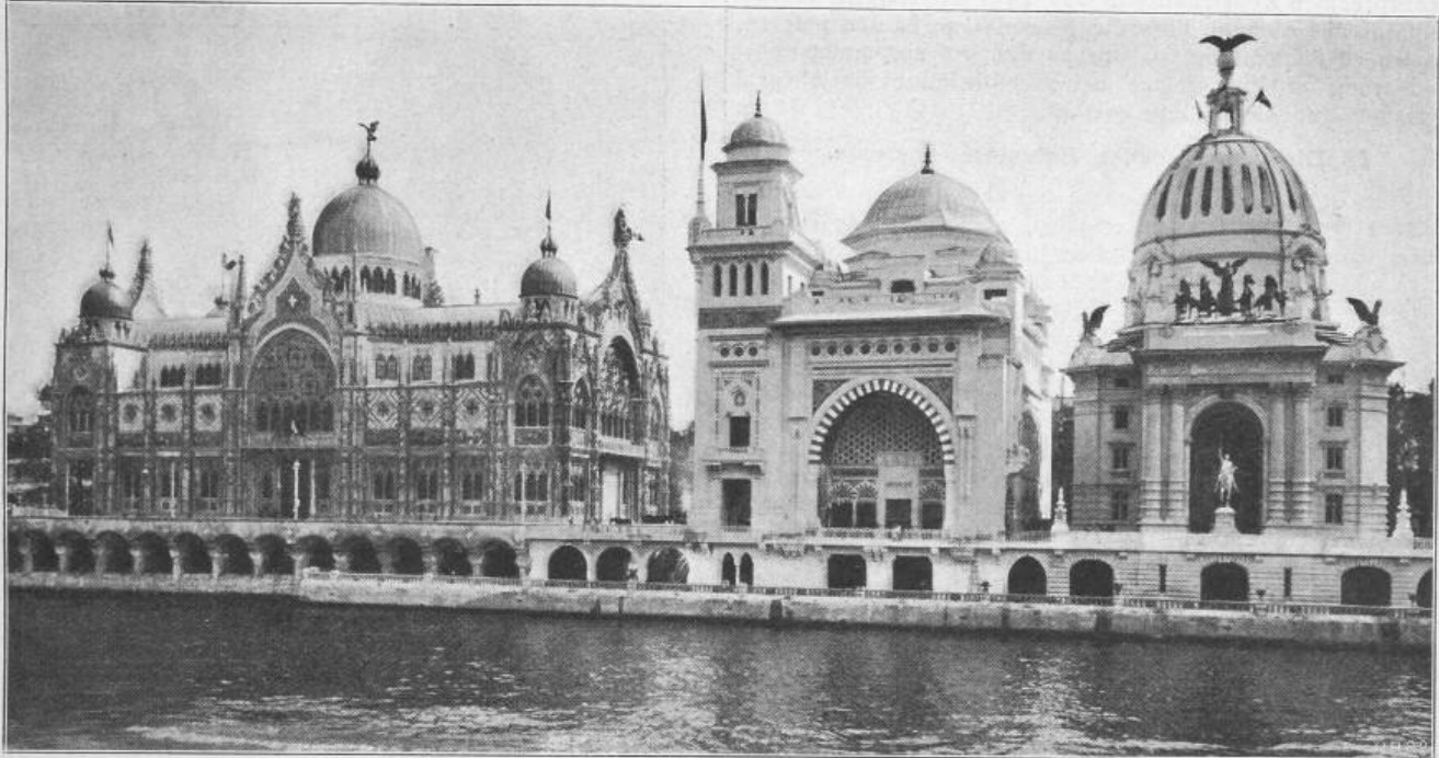
Fig. 1. Italien.