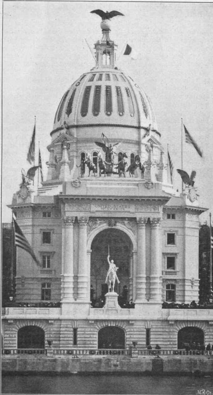
Fig. 3. Pavillon der Vereinigten Staaten von Nordamerika.

Architekten: Coolidge und Morin Goustiaux.