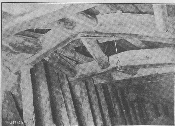
Fig. 1. Sicherungseinbau an den zerdrückten Stellen des Neuländer-Tunnels.

letzterer mit anschliessendem, 8 m langem überwölbtem Einschnitt an der West- und 16 m langem überwölbtem Einschnitt an der Ostseite.