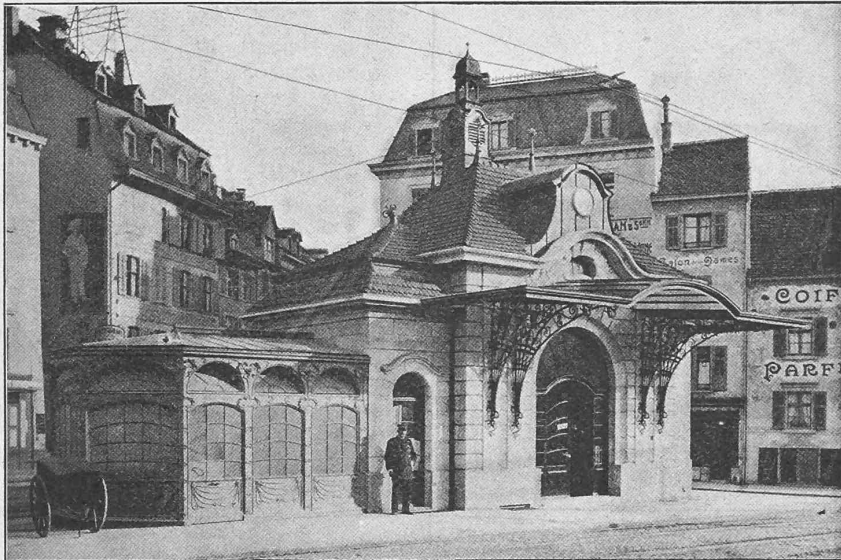
Abb. 1. Vorderansicht.

Das Stationsgebäude umfasst getrennte Warteräume für das Publikum und das Personal, sowie ein Bureau für den Stationsmeister und ein Verkaufslokal.