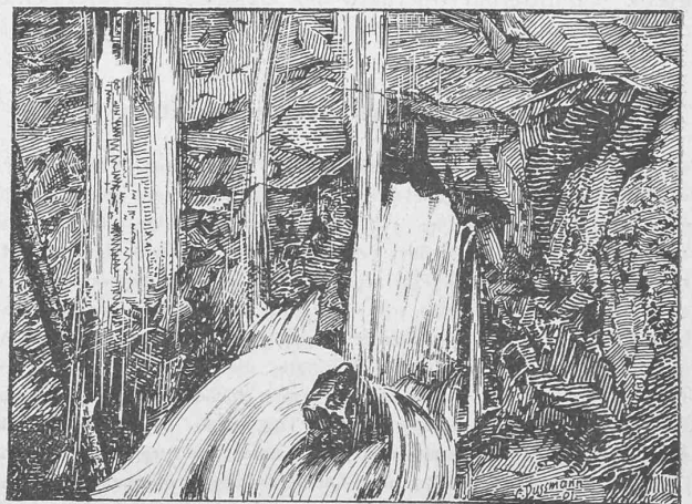
Wassereinbruch im Stollen II bei Stat. 4462.

dessen Ausführung weitere 8 Millionen Dollars vorgesehen werden. Auch der Plan, den Hudson im Tunnel zu unterfahren um New-York mit dem Festland zu verbinden taucht neuerdings wieder auf. Bekanntlich ist dieses Unternehmen vor einer Reihe von Jahren schon begonnen und, nachdem es Millionen gekostet, wieder liegen gelassen worden. Die Kosten für seine Ausführung werden jetzt auf 100 Millionen Dollars geschätzt. Auch die Long Island Railroad Company bereitet zur Zeit den Bau eines Tunnels unter dem East-River vor, um ihre gegenwärtige Endstation auf Long-Island mit New-York in Verbindung zu setzen. Andererseits geht die Pennsylvania Railroad Company damit um, eine achtgleisige Brücke von 900 m Spannweite, die auch dem Fussgängerverkehr dienen soll, über den Hudson