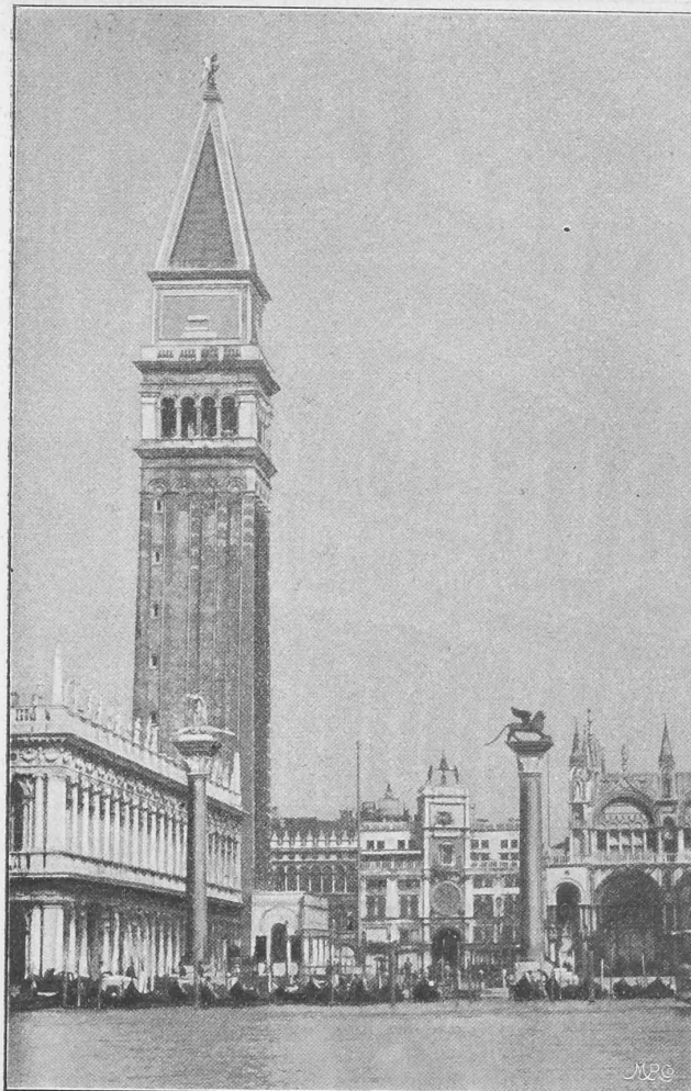
Der Turm von San Marco von der Piazzetta aus gesehen.