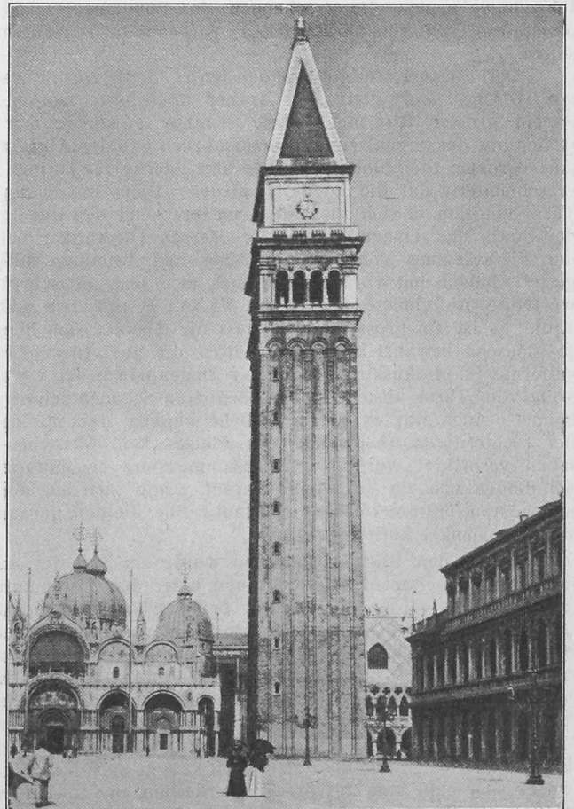
Ansicht des Turmes von der Piazza San Marco aus.

Sämtliche Entwürfe sind im Saale der Brauerei Oerlikon, von Sonntag 20. Juli bis Samstag 26. Juli, je vormittags von 8—12 und nachmittags von 1—7 Uhr öffentlich ausgestellt.