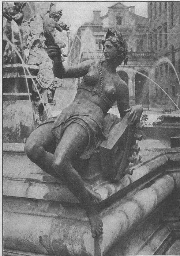
Schmutter, Phot. von Kutscher & Gehr in Augsburg.