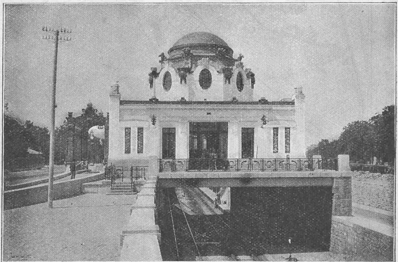
Abb. 3. Station Hietzing der oberen Wientballinie.

behördlichen Behandlung unterzogen. Im Jahre 1873 lagen im ganzen nicht weniger als 23 Entwürfe über Stadtbahnanlagen und Wienkorrektur dem Handelsministerium vor; der Gemeinderat gab damals jenem von Baurat Schwarz den Vorzug. Infolge einer finanziellen Krisis wurde indessen diese Angelegenheit nochmals in den Hintergrund gedrängt und erst im Jahre 1881 sind wieder neue Projekte aufgestellt worden, von denen dasjenige der Engländer Fogerty & Bunten bis zum Stadium der Konzessionserteilung gelangte. Die Konzession wurde aber 1886 von der österr. Regierung als erloschen erklärt, weil der finanzielle Nachweis nicht erbracht werden konnte. Die Firma Siemens & Halske hatte schon 1884 ein Projekt für eine schmalspurige elektrische Bahn eingereicht, das aber nicht angenommen wurde, in der Befürchtung, dass dadurch das Zustandekommen von weitern Stadtbahnen mit Dampfbetrieb verhindert werden könnte.