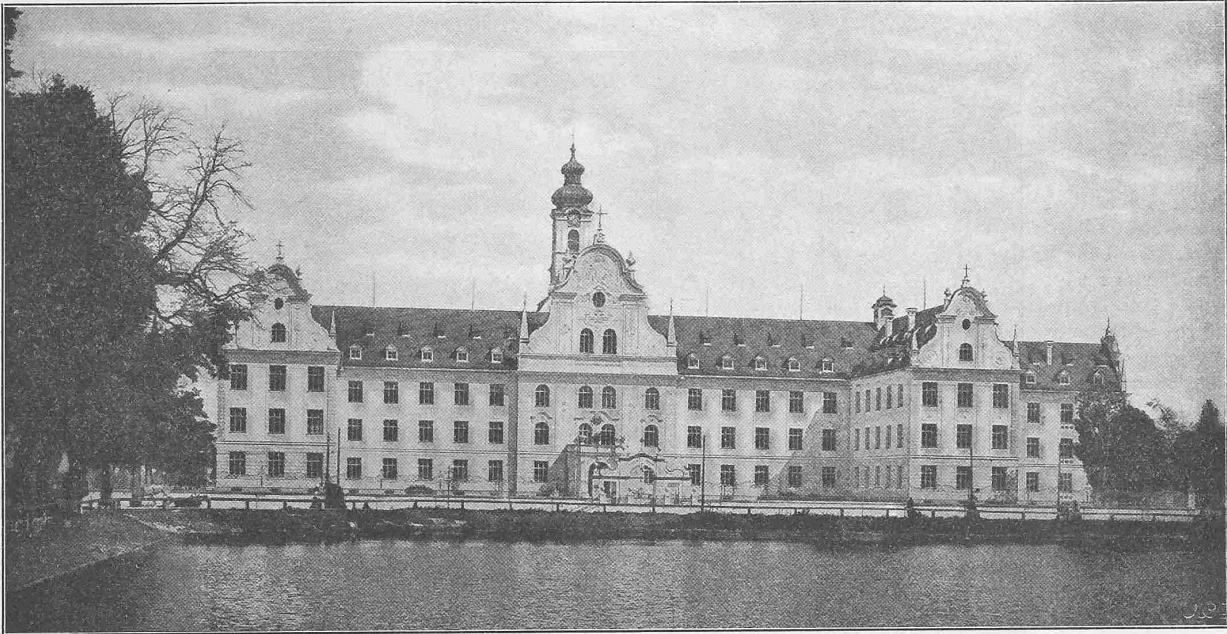
Abb. 1. Ansicht von Nordwesten.

Stromzuführung. Die Wasserleitung von Coolgardie. Die Klosterkirche zu Herrenalb. Wiederaufbau des Hauses an der Treib. Prugelstrasse. Die 44. Hauptversammlung des Vereins deutscher Architekten und Ingenieure. — Nekrologie: † A. Roth, † E. Züblin. — Konkurrenzen: Aufnahmegebäude im Bahnhof Basel. — Literatur: Münchener bürgerliche Baukunst der Gegenwart. — Vereinsnachrichten: Zürcher Ingenieur- und Architekten-Verein. Hierzu eine Tafel: Das Städtische Waisenhaus in München.