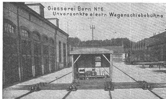
Giesserei Bern N o 6. Unversenkte electr. Wagenschiebebühne

Hebezeuge jeder Art als: Laufkräne , und feste od. fahrbare Drehkräne für Hand- und speziell elektrischen Betrieb; Aufzüge für hydraulischen, elek- trischen , und Transmissionsbetrieb.