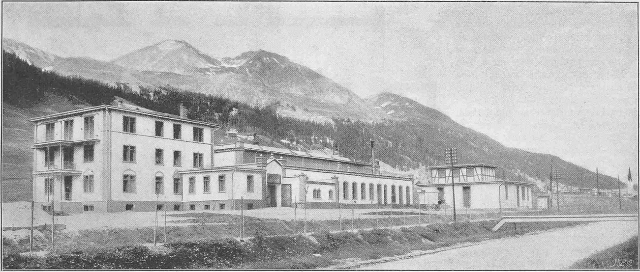
Abb. 2. Gesamtansicht der Anlage von Südosten.

Hiezu eine Tafel: Wettbewerb zur Erlangung von Mosaikbildern im Hofe des Landesmuseums in Zürich.