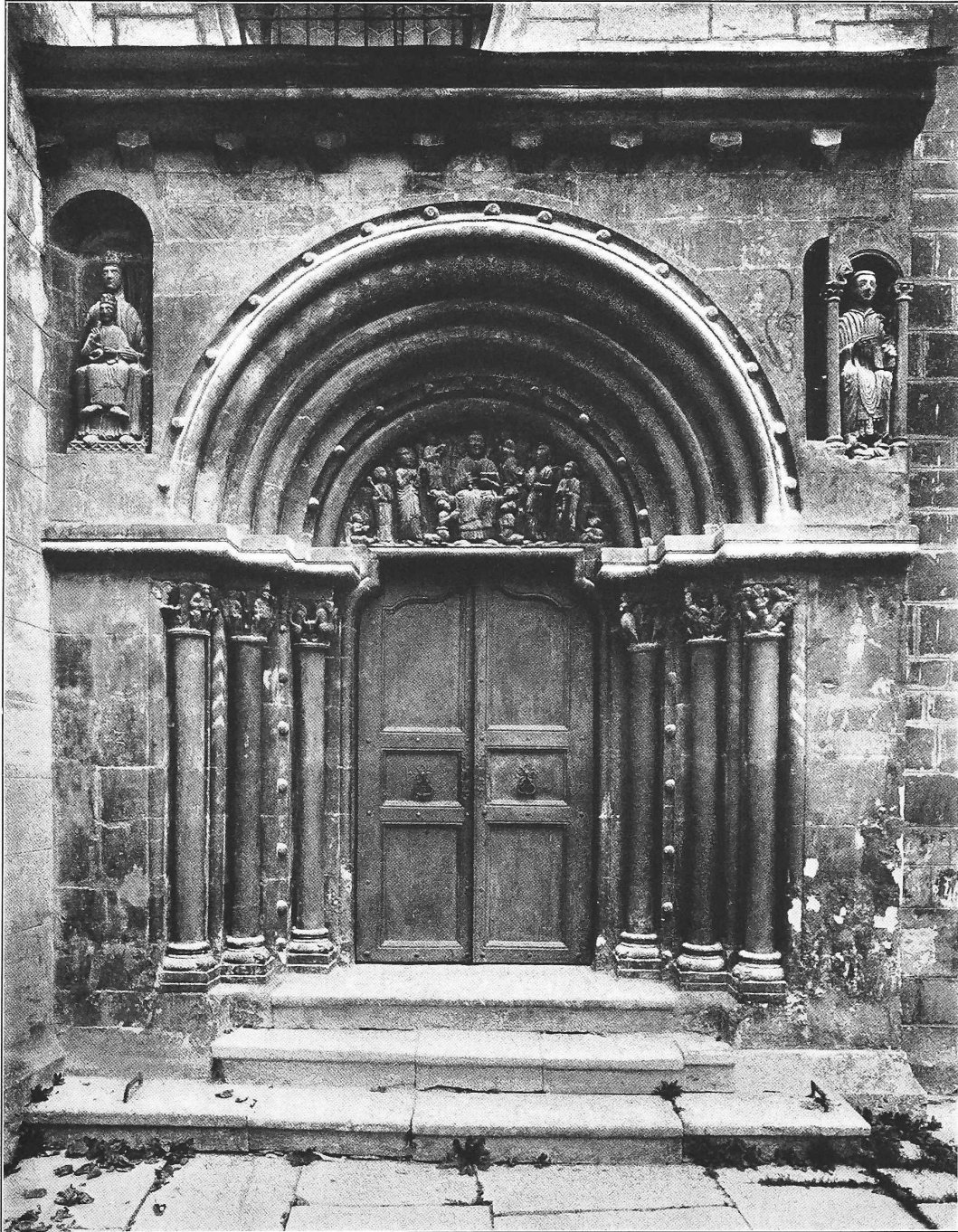
Das Südportal der Stiftskirche von St. Ursanne im Berner Jura.