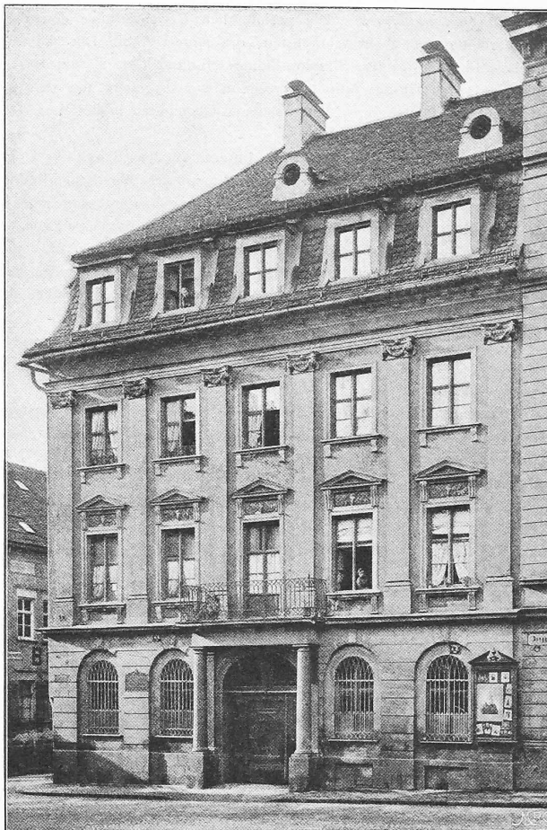
Abb. 1. Haus am Zeugplatz in Augsburg.

„Architektur von 1750—1850.“ Herausgegeben von Lambert & Stahl. 1)