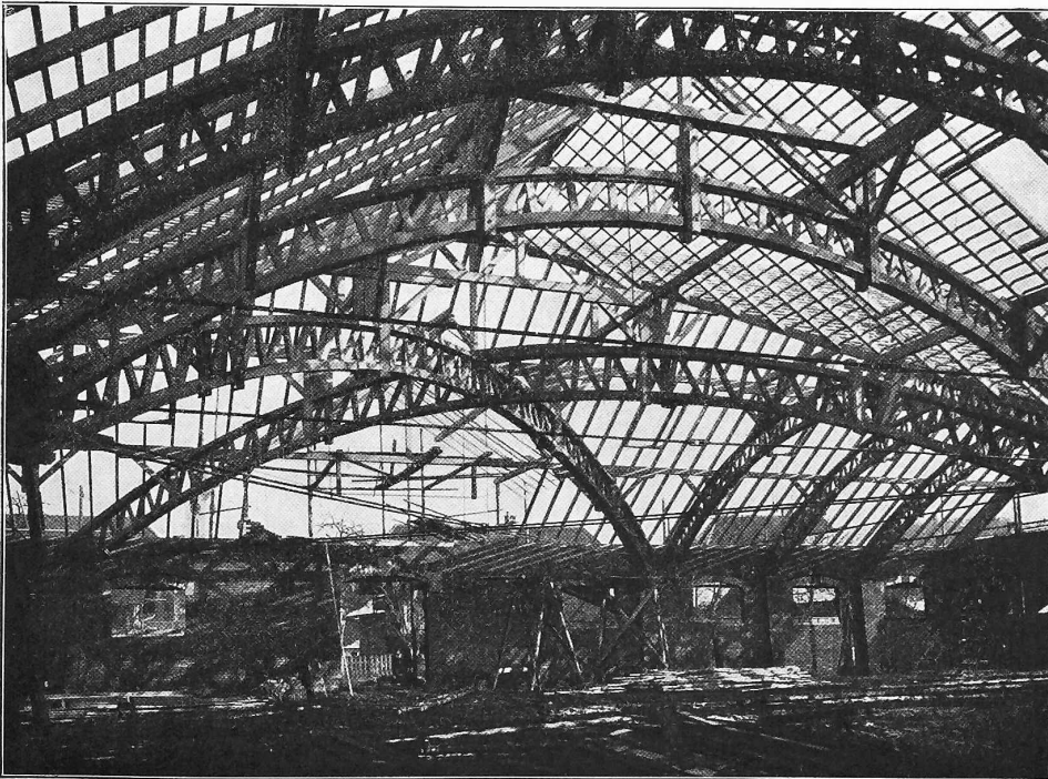
Abb. 2. Dachkonstruktion der Markthalle in Langenthal (Bern).

Das 78 km von Bilbao entfernte Kraftwerk Quintana-Martingalindez, das der Societä Hidro-electrica Iberica in Bilbao gehört und von den Siemens-Schuckert-Werken in Berlin erbaut wurde, ist nach der E. T. Z. soeben in Betrieb genommen worden. In der Primärstation haben Turbinen von je 1000 P. S. bei 375 Umdrehungen per Minute zum Antrieb von Drehstrommotoren von 3000 Volt Verwendung gefunden. Der Strom wird auf 30000 Volt hinauftransformiert. Das Werk ist für eine Energieabgabe von etwa 4000 P. S. eingerichtet und wird