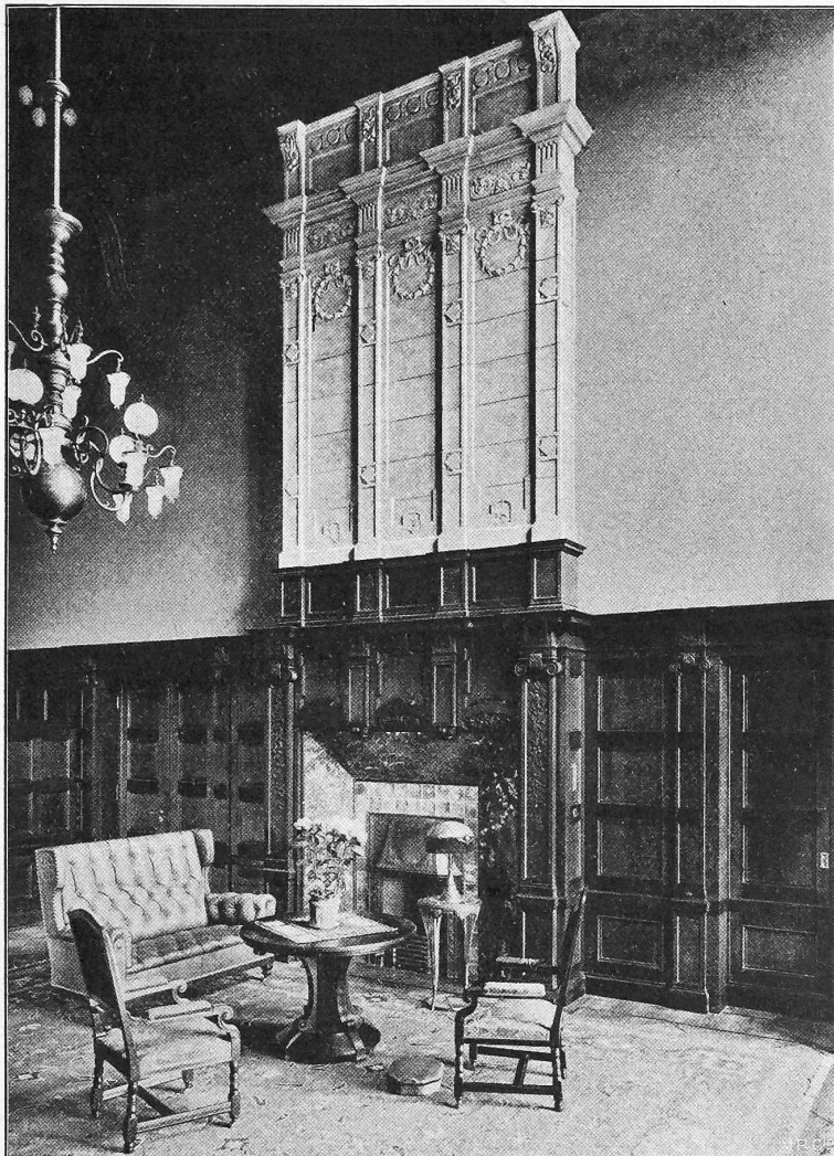
Abb. 1. Kaminpartie in der Diele der Villa Noelle in Berlin-Grünwald. Nach Entwürfen von Solf & Wichards , Architekten in Berlin.

Nach einer Tafel des bei Ernst Wasmuth in Berlin erscheinenden Werkes.