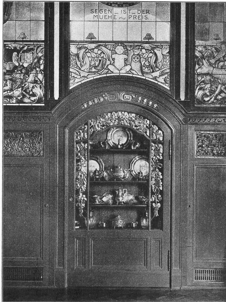
Abb. 3. Silberschrank im Esszimmer der Villa Stollwerk in Köln a. Rh. Nach Entwürfen von Professor Bruno Schmitz in Charlottenburg.

Nach einer Tafel des bei Ernst Wasmuth in Berlin erscheinenden Werkes.