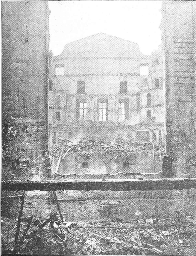
Abb. 4. Blick von der Bühne in den Zuschauerraum. Im Vordergrund der zerstörte eiserne Vorhang.

und in Höhe des zweiten Stockwerks durch eine Zwischendecke geteilt, wodurch eine obere und eine untere Mittelhalle entstanden sind. Beide wurden mit Tonnengewölben überdeckt, die in der untern Halle von schlichten viereckigen Pfeilern, in der obern aber von acht kräftigen Säulen aus rotem Miltenberger Sandstein getragen werden. Der Fussboden ist hier mit dunkelgrünen Tonfliesen belegt und die Brüstungsgitter der Hallen und Treppenhäuser aus Tombakmetall mit getriebenen Füllungen hergestellt. Eine breite mit Sandsteinbildwerk umrahmte Tür führt von der obern Halle in die nach Süden gelegene Aula, die 28 m lang und 12 m breit eine besonders reiche Ausstattung erhalten hat. Die für den Bau ohne innere Einrichtung aufgewendete Kostensumme beträgt nach dem Z. d. B. etwa 3 383 000 Fr.; für die innere Einrichtung einschliesslich derjenigen des physikalischen Instituts, jedoch ausschliesslich der Ausstattung mit Apparaten, sind etwa 512 000 Fr. vorgesehen, sodass die Erbauung des Hauptgebäudes der