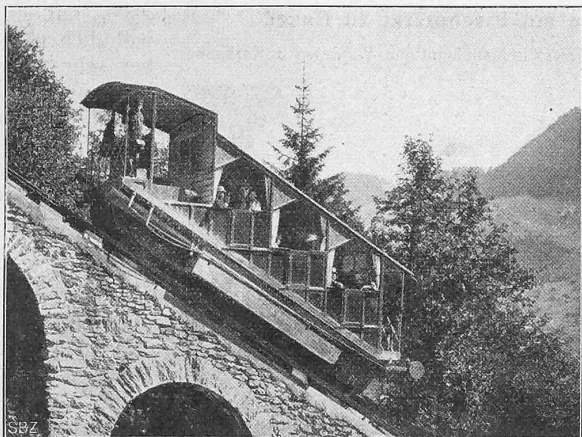
Abb. 2. Der alte Wagen mit Wasserballast.

von der andern die Bremswirkung auf beide Achsen verteilt. Beide Bremssysteme können von den Wagenenden aus mit Spindel oder Pedal bedient werden. Das Aufsteigen des obren Zahnrades und Entgleisen des Wagens wird durch einen beweglichen, unter die ] Eisen der Zahnstange greifenden Fanghaken wirksam verhindert. Das Gewicht des Untergestells beträgt 4850 kg, dasjenige des vollständigen,