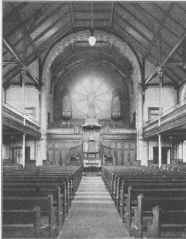
Fig. 4. Vue de l'intérieur.