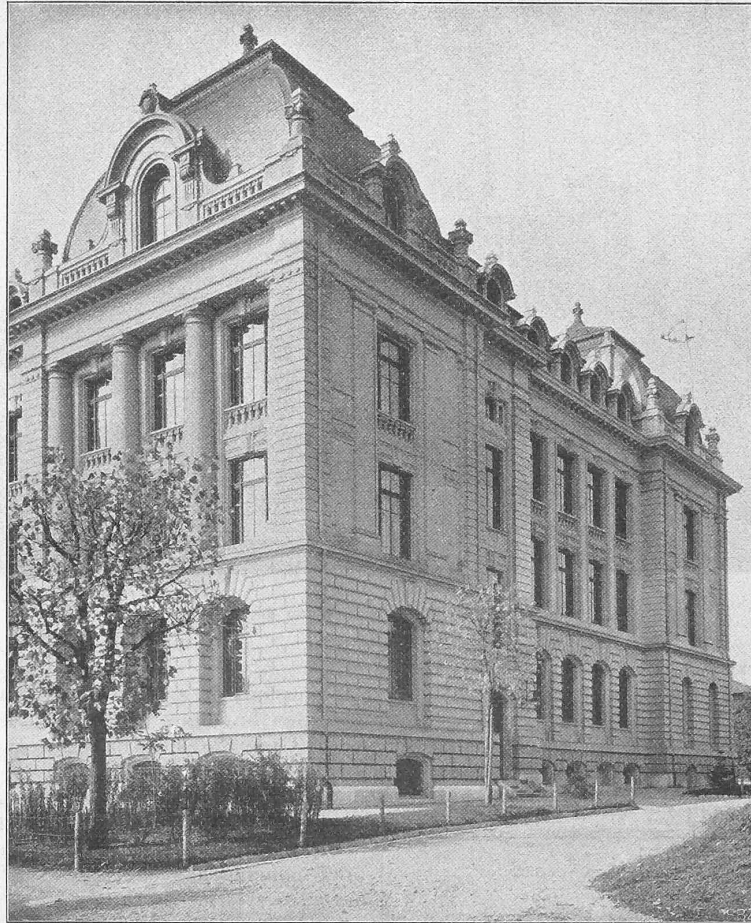
Abb. 12. Ansicht der östlichen Seitenfassade des Gebäudes.

Erbaut von den Architekten Hodler und Joos in Bern.