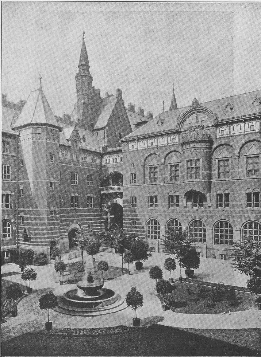
Abb. 2. Blick in den offenen Hof. (Nach «Beispiele angewandter Kunst», vergl. S. 203.)