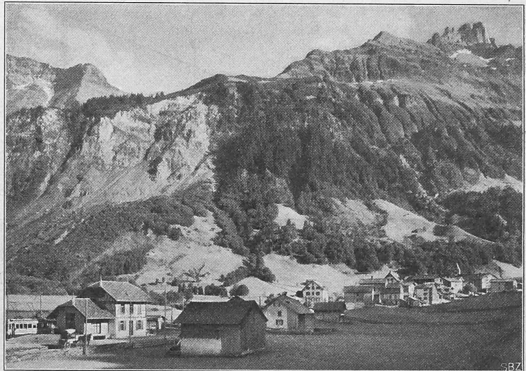
Abb. 8. Ansicht von Dorf und Bahnhof Elm.

Die Entstehungsgeschichte der Sernftalbahn reicht in