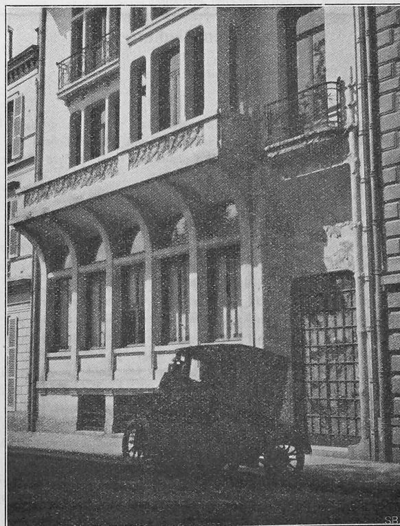
Abb. 14. Detail vom Hause René Lalique.