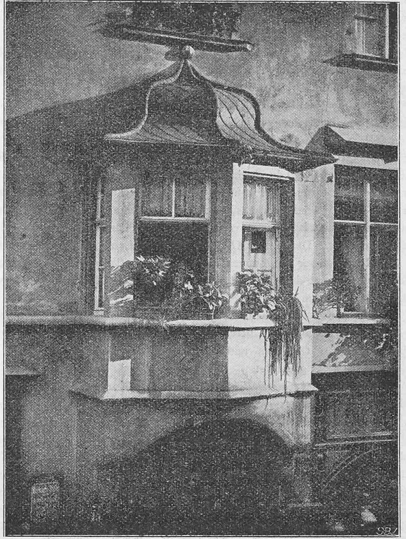
Abb. 2. Erker vom Hause Kramergasse Nr. 15.

(Nach «Blätter für Architektur und Kunsthandwerk».)