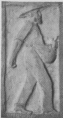
Abb. 21. Detail eines Emporenkapitälts.

8. Dieser Bundesbeschluss wird nach Massgabe von Art. 89, Abs. 2, der Bundesverfassung als dringlich erklärt und tritt sofort in Kraft.»