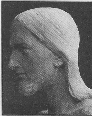
Abb. 20. Kopf der Christusfigur in der Pauluskirche zu Bern.