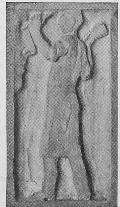
Abb. 22. Detail eines Emporenkapitälts.

wir auf einen seit dem 16. Januar 1905 durchgeführten Versuchsbetrieb auf der Teilstrecke Seebach-Affoltern zu verweisen. Dieser Versuchsbetrieb hat ergeben, dass hohe Spannungen vollständig betriebssicher verwendbar sind und dass es möglich ist, wie wir an der Frankfurter elektrischen Ausstellung nachgewiesen haben und wie es seither in der Kraftübertragungstechnik geschieht, die mit solch hohen Stromspannungen erreichbare Wirtschaftlichkeit auch bei den Fahrdrathleitungen von Bahnen auszunützen. Die Verlängerung Affoltern-Regensdorf befindet sich in Ausführung und wurde nur deshalb nicht früher in Angriff genommen, weil erst Gewissheit darüber erlangt werden musste, ob die der ganzen Strecke entlang gehenden interurbanen Telefonstränge nicht gestört, und ob die mit der Verlegung dieser Stränge verbundenen Kosten vermieden werden können, was nunmehr der Fall ist. Wir hoffen nun in kürzester Zeit zum Abschluss unserer Versuchsanlage zu kommen. Wir bedauern nur, dass mit der Einführung des elektrischen Betriebes im Simplontunnel nicht zugewartet werden konnte, bis die Resultate der Versuche,