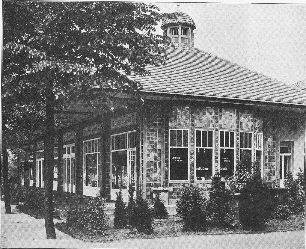
Abb. 27. Ladeneinrichtungen in Eisenkonstruktion mit Wandverkleidungen in farbigen Fliesen. — Architekt Prof. Fritz Schumacher in Dresden.

«Deutsches Museum» als offizielle Bezeichnung für das Unternehmen gewählt. Nach genauen Berechnungen sind die Kosten für den Neubau mit Einschluss aller technischen Einrichtungen und der künstlerischen Ausschmückung auf 7 Millionen Mark veranschlagt, wovon das Königreich Bayern, das Deutsche Reich und die deutsche Industrie je 2 Millionen Mark, die Stadt München (die auch den Bauplatz im Werte von 2 Millionen gab) 1 Million tragen sollen. (Schluss folgt.)