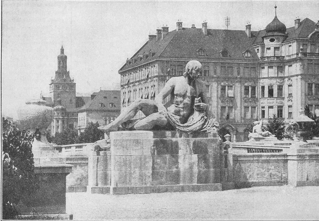
Abb. 20. Von der Prinzregentenbrücke. — Statue «Franken» von Balthasar Schmitt in München.

Gebilde des Meissels. Die erste Figur auf der westlichen Seite rechter Hand hat Prof. H. Hahn gebildet. Das Motiv hat einen am Boden liegenden nackten Mann, einen ruhenden Schnitter zum Gegenstand. Die kräftigen Formen des schönen männlichen Körpers zeichnen sich ruhig und klar gegen die Häusermassen der Prinzregentenstrasse ab. Die nächste Umgebung gibt einen Masstab für die Grösse des Bildwerkes, das sich den architektonischen Massen gegenüber behauptet. An der westlichen Seite (linker Hand) erhebt sich in gleicher Lage eine weibliche Figur mit einer