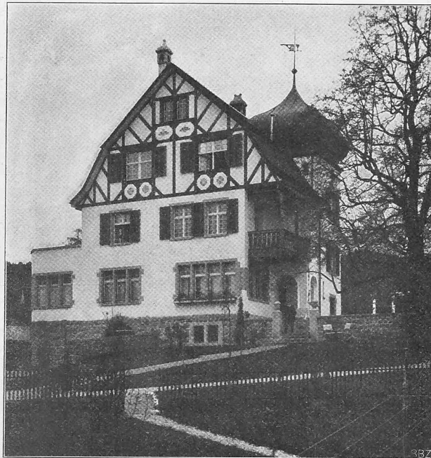
Abb. 1. Ansicht des Landhauses «Grieg» bei St. Gallen.

Farben die Festigkeit der Steine etwas herabsetzt. Kalksanddachsteine haben sich wenig bewährt, insbesondere hat man mit den von verschiedenen Firmen angepriesenen sogenannten Erdglasuren schlechte Erfahrungen gemacht, indem sich diese Ueberzüge als nicht wetterbeständig erwiesen haben. Lebhaft wurde beklagt, dass viele Behörden dem Kalksandstein noch mit ungerechtfertigtem Misstrauen begegnen. Um dem entgegenzutreten, soll ein Verzeichnis derjenigen grösseren, namentlich öffentlichen Bauten angelegt und veröffentlicht werden, die aus Kalksandsteinen der Vereinsmitglieder erbaut worden sind. Gegenwärtig bestehen in Deutschland etwa 250 Kalksandsteinfabriken, die ihre Erzeugnisse bereits zu zahlreichen, teilweise auch architektonisch hervorragenden Bauten geliefert haben. Gegen die Herstellung und den Verkauf minderwertiger Kalksandsteine will