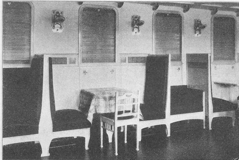
Abb. 8. Wandpartie im Salon I. Klasse.

Am auffälligsten tritt der nämliche Umstand wohl im äussern Anstrich des Schiffes auf. Während früher die Schweizerschiffe der Bodensee-Flottille einen schlichten, vielleicht allzuernsten Farbencharakter trugen, vorwiegend graublau und ziemlich tonlos, bekam der „Rhein“ einen in der Hauptsache weissen Anstrich mit roten Zwischengliedern. An Heck und Bug fielen die früher üblichen, auf die eiserne Unterlage applizierten, holzgeschnitzten Ornamente weg. An ihre Stelle traten Beläge in kräftigem, durch starke Nietten befestigtem Eisenblech: Vorn wellige Streifen, wie sie auf den alten Schweizerbannern zu sehen sind, rückwärts eine durch senkrechte Stäbe bewirkte Teilung, in deren einzelnen Feldern nochmals das Wellenlinien-Motiv wiederkehrt. Gerade diese Neuerung hat mancherlei Widerspruch wachgerufen, wie das ja immer zu sein pflegt Dingen gegenüber, die aus den gewohnten Geleisen heraus-treten. Ich tröstete mich darüber — sprach doch bei der Schiffseinweihung ein Mann, der nicht überall den Normal-Masstab anzulegen gewohnt ist, das Wort aus: „Was tuts! Heute lachen sie darüber und übers Jahr machen sie's nach!“