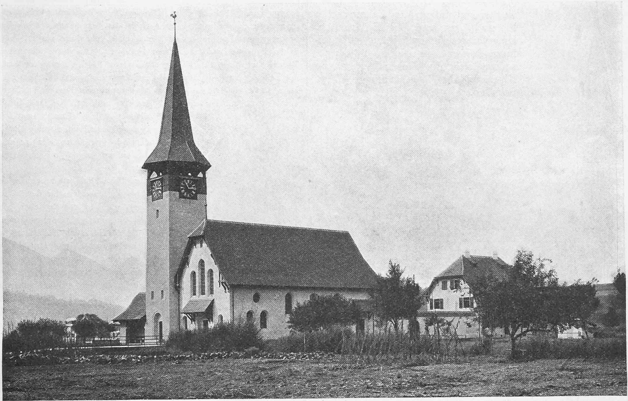
Abb. 1. Schaubild von Kirche und Pfarrhaus in Balsthal von Osten.

Nachdruck von Text oder Abbildungen ist nur unter der Bedingung genauester Quellenangabe gestattet.