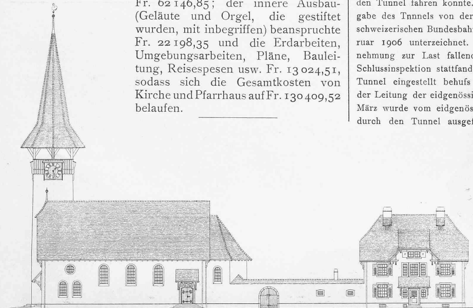
Abb. 3. Ansicht der Nordfassaden von Kirche und Pfarrhaus zu Balsthal. — Masstab 1 : 500.

Die allgemeinen Baukosten betragen für das Pfarrhaus Fr. 33 039,81, für die Kirche Fr. 62 146,85; der innere Ausbau (Geläute und Orgel, die gestiftet wurden, mit inbegriffen) beanspruchte Fr. 22 198,35 und die Erdarbeiten, Umgebungsarbeiten, Pläne, Bauleitung, Reisespesen usw. Fr. 13 024,51, sodass sich die Gesamtkosten von Kirche und Pfarrhaus auf Fr. 130 409,52 belaufen.