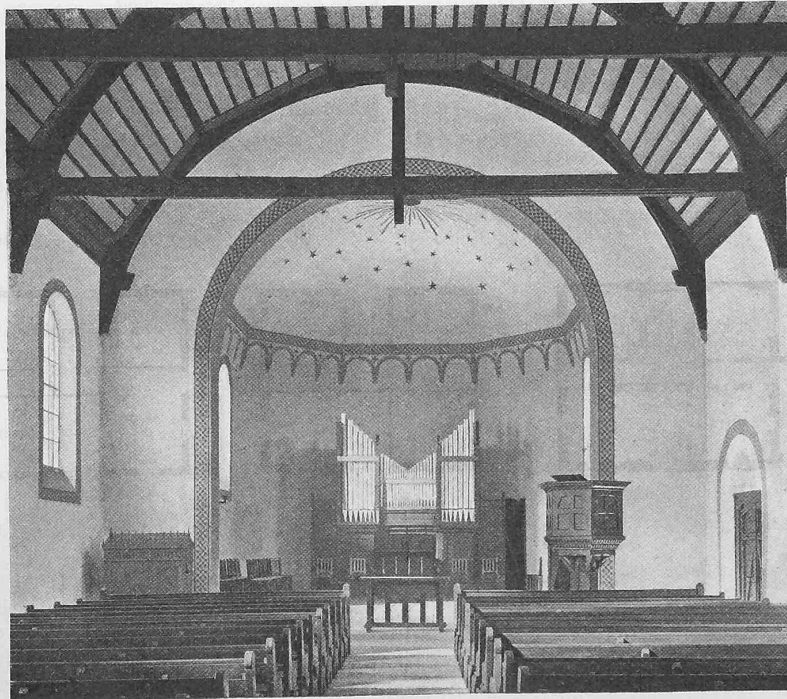
Abb. 5. Blick in den Kirchenraum gegen das Chor.

Das durchfahrene Gestein wechselt zwischen Nagelfluh, die vorherrscht, und Mergelsandstein.