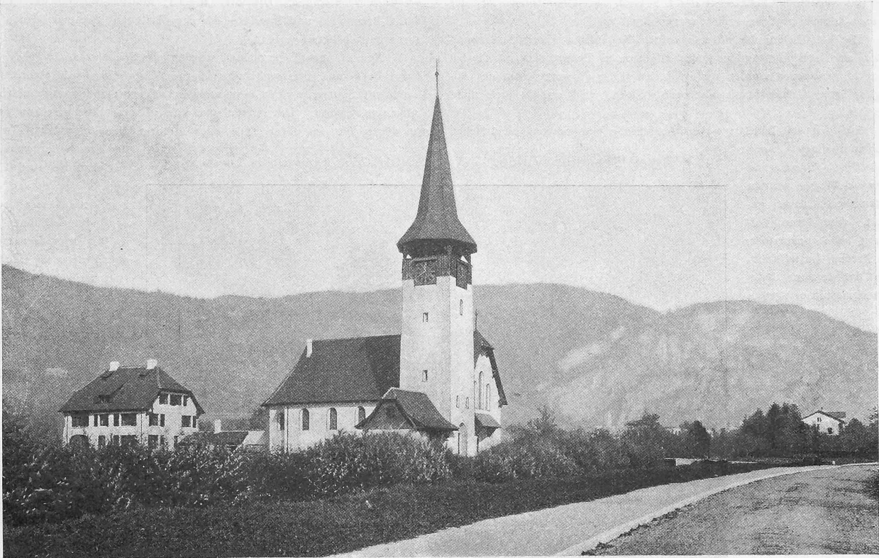
Abb. 4. Schaubild von Kirche und Pfarrhaus von Süden.

Auf der Rickenbahn wurde der Bau des 8604 m langen Rickentunnels eifrig fortgesetzt und dank den andauernd günstigen Verhältnissen wesentlich gefördert. Der Stollenvortrieb erfolgte, wie bisher, auf beiden Seiten ausschliesslich von Hand. (Wir verweisen auf die regelmässig von uns veröffentlichten Monatsausweise über den Stand der Arbeiten.)