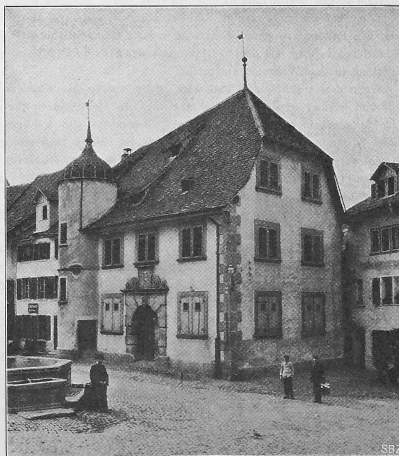
Abb. 2. Haus in Brugg (vergl. Literatur S. 208).

Die in No. 11 dieser Zeitschrift (Seite 131) veröffentlichten interessanten Ausführungen über die Versuche an der Verbundturbine in Wiesberg haben in No. 15 durch Herrn Ingenieur Schnyder in Kriens einen Kommentar erfahren, der wohl jedem Turbinenkonstrukteur eine Aufklärung über die drei ersten einfachen Spirlturbinen dieser Anlage wünschen lässt.