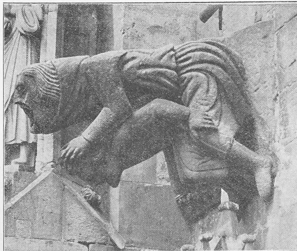
Abb. 3. Wasserspeier an der südlichen Langhausfassade.