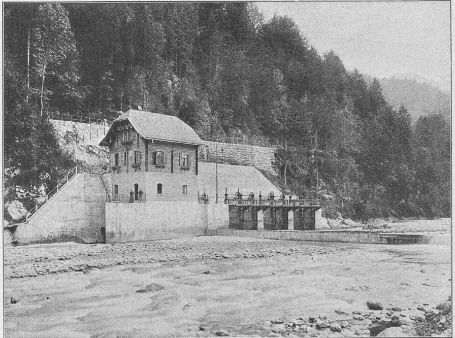
Abb. 9. Ansicht der Wasserfassung in der Bregenzer Ach unterhalb Bezau.

Da das Riedener Werk nur einen verhältnismässig kleinen Teil des Strombedarfes ständig deckt, und in erster Linie die Aufgabe hat, mittels seiner Dampfanlage den Betrieb zu sichern, und den Kraftausfall bei Niederwasser zu decken, fällt der Hauptanteil an der Stromlieferung der hydro-elektrischen Zentrale Andelsbuch zu. Dieses im Januar 1908 in Betrieb gestellte Werk, dessen Anlagen mit grosser Sorgfalt ausgeführt sind, dürfte für die Leser dieser Zeitschrift von Interesse sein, weshalb es im Nach-