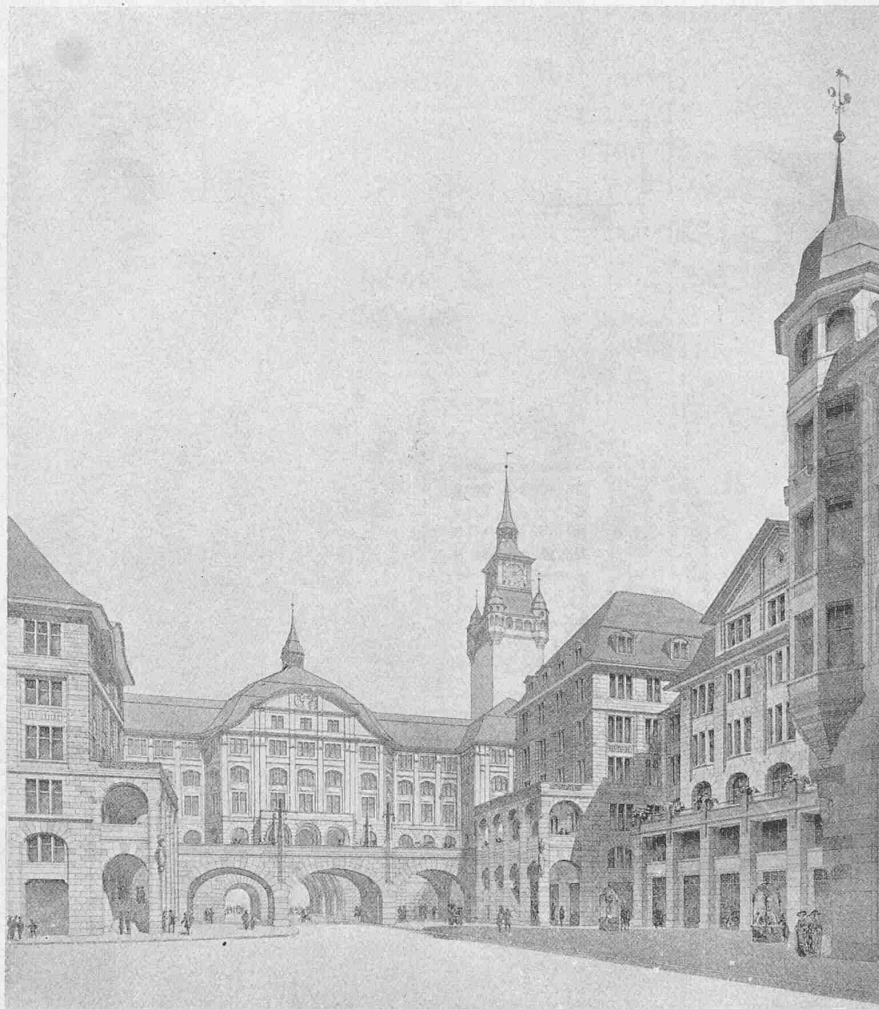
Abb. 3. Der Werdmühleplatz. Perspektive von der Bahnhofstrasse aus.

Der Lageplan 1:2000 (Abbildung 1) auf Seite 158 weicht von dem in Band XLVI, Seite 52 1) im Masstab von 1:7500 dargestellten Uebersichtsplan bis auf den grössern Masstab nicht stark ab; nur sind darin die zunächst, im Anschluss an das umzubauende Waisenhaus zu erstellenden Bauten für Polizei-, Gesundheits- und Schulwesen zwischen Werdmühlestrasse und Lindenhofstrasse, sowie der südlich des Werdmühleplatzes im Anschluss an das Gebäude der „Urania“ projektierte Bau, deutlicher in ihren definitiv festgelegten Grundrissen zu erkennen. Desgleichen ist die nunmehr fertig ausgebaute westliche Wand des Werdmühleplatzes eingetragen mit dem Gebäude der „Urania“ südlich der Stadthausstrasse und jenem der Schweizerischen Bodenkreditanstalt nördlich derselben.