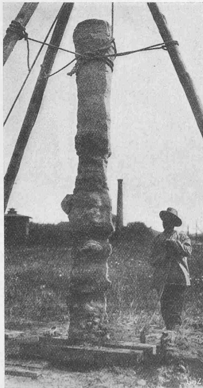
Abb. 1. Ausgrabener Strausspfahl.

Das Verfahren wurde in dieser Zeitschrift bereits früher schon kurz beschrieben, und zwar gelegentlich der Besprechung der auf Strausspfählen fundierten neuen Garnisonskirche in Ulm a./D. und der neuen Bahnhofshallen in Karlsruhe 1) . Nach der dort gegebenen kurzen Beschreibung wird für die Ausführung von Strausspfählen zuerst unter Abteufen eines Stahlrohres ein Bohrloch hergestellt. Ist der tragfähige Baugrund, oder, bei schwebender Pfählung die erforderliche Tiefe erreicht, so wird das Bohrloch unter allmählichem Heben des Stahlrohres in kräftiger Weise mit Beton ausgestampft, und zwar solange, bis sich keine messbare Zusammenpressung des Betons mehr ergibt. Dadurch wird eine gleichmässige Verdichtung der verschiedenen Bodenschichten erreicht, und es bilden