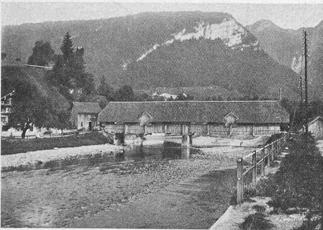
Abb. 1. Alte Muotabrücke bei Hinter-Ibach.

Unter diesen neu erstellten Brücken ist wohl die armierte Betonkonstruktion in Hinter-Ibach als interessantestes Bauwerk besonderer Beachtung wert. Die Vorgängerin dieser neuen Brücke war eine hölzerne Sprengwerkbrücke (Abbildung 1), in doppelter Anordnung zwischen den Endauflagern und einem Mittelpfeiler, zwei Oeffnungen von je rund 17 m überspannend; ihre nutzbare lichte Breite betrug 2,70 m. Der Hochwasserstand am 14./15. Juni 1910 berührte das Gebälke der Tragkonstruktion, obwohl ober-