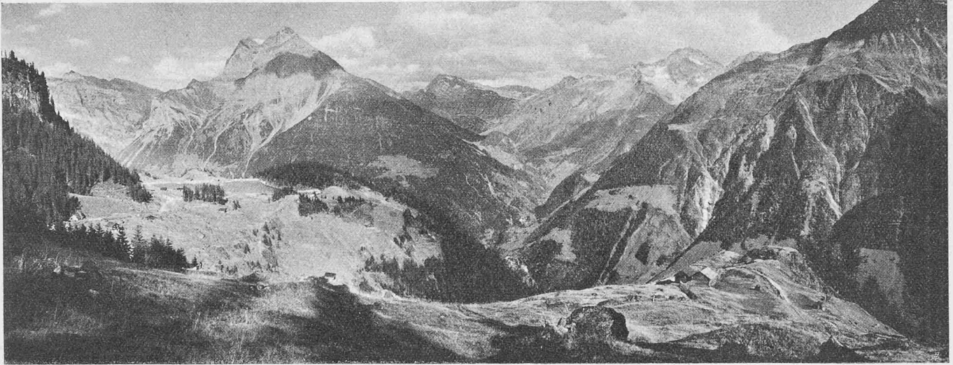
Abb. 2. Blick vom Abhang der «Heissen Egg» ostwärts über das Leutschachtal auf den Arniberg mit dem Stauweiher.