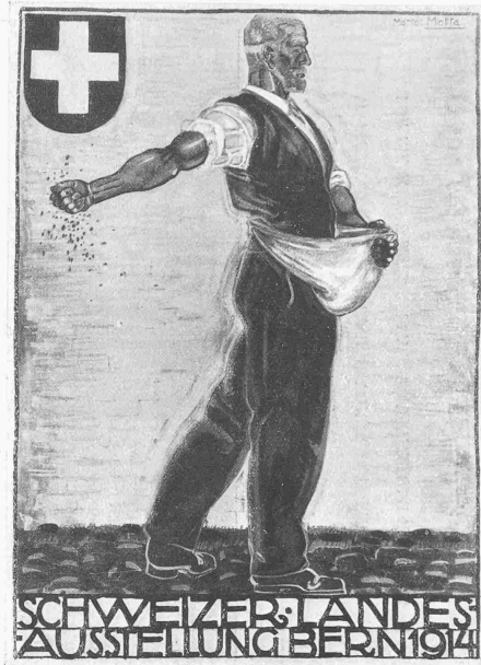
II. Preis ex aequo. Verf. O. BAUMBERGER, Zürich