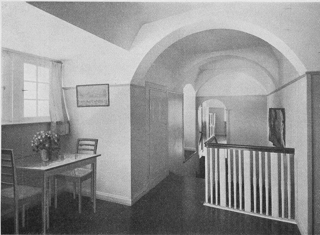
Abb. 2. Oberer Flur eines Landhauses in Schlachtensee bei Berlin. Aus dem Werk «Landhäuser» von Hermann Muthesius. — Verlag F. Bruckmann A.-G., München.

tümlichkeiten des jeweiligen Bauplatzes berücksichtigt, dem ortsüblichen Baumaterial Rechnung getragen, die Wünsche und Lebensweise des Bauherrn und seiner Angehörigen aufs eingehendste studiert und daraus ein Bauorganismus entwickelt, der eine Persönlichkeit darstellt. Allen diesen Häusern gemeinsam ist der Zug nach grossen Hauptaufenthaltsräumen, die sorgsam nach Himmelsrichtung und Aussichtslage angelegt sind. Mit ausserordentlichem Geschick sind Küche, Anrichte und alle jene grössern und kleinern Nebengelasse angeschlossen, die unserm anspruchsvollern oder bescheideneren Bedürfnis nach Bequemlichkeit, Ordnung und Hygiene dienen müssen. Kein Winkel bleibt unbenutzt, keine Ecke ungelöst. Wie Fenster und Türen in der Wand sitzen, die Treppen sich hinaufdrehen, die Räume gegeneinander