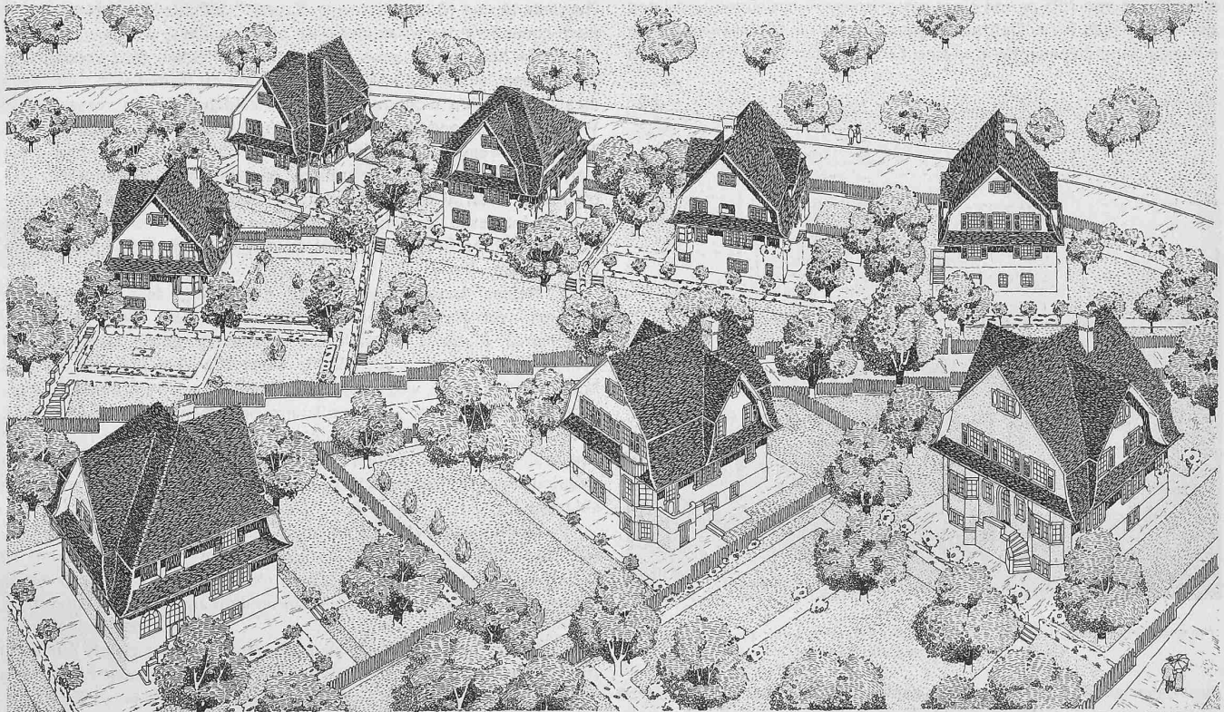
VILLENGRUPPE UF UND DY ALLE WINDE

Es waren 15,2 km definitive Geleise und auf den Stationen zusammen 21 Weichen verlegt. Vom Geleise lagen 820 m noch auf dem Planum, 8260 m auf der ersten und 4420 m auf der zweiten Schotterlage; bis Km. 10,8 ab Frutigen lag durchgehendes Geleise. Mit Ausnahme der Stellwerkgebäude und der Lokomotivremise Kandersteg waren die Hochbauten im Rohen vollendet.