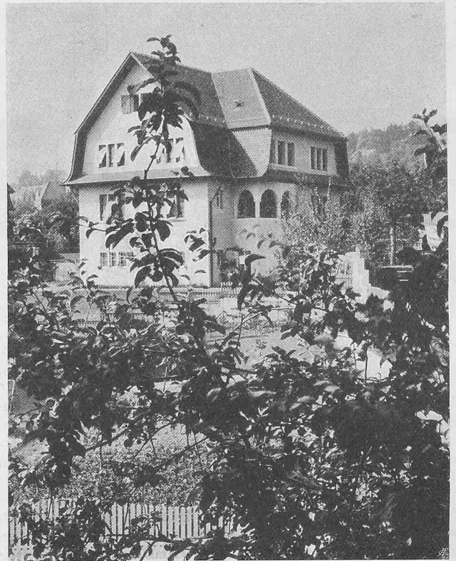
Abb. 7. Ansicht von Süden des Hauses Keltenstrasse Nr. 28.