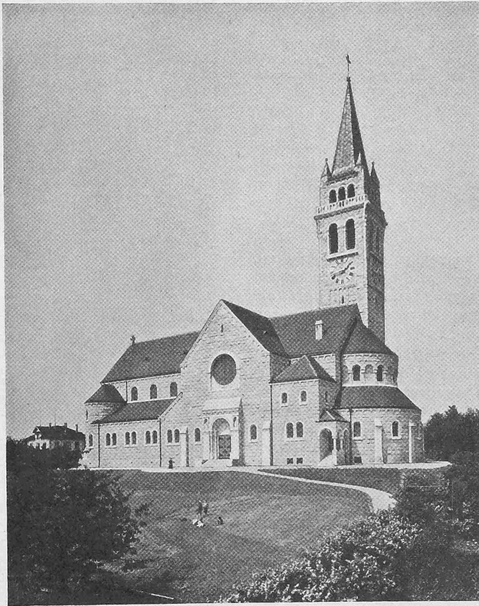
Abb. 3. Ansicht von Südosten.

Der Gesamteindruck des Innern ist der grosser Weit-