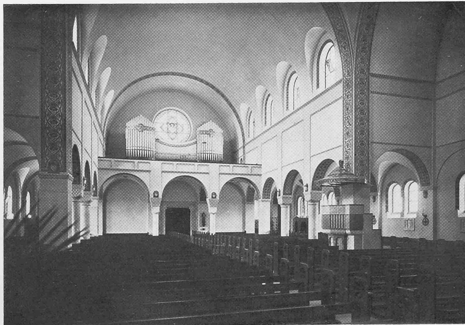
DIE NEUE KATHOLISCHE KIRCHE IN ROMANSHORN