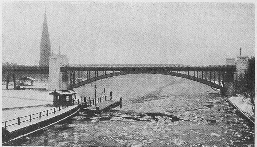
Abb. 20. Kuhmühleleichen-Brücke der Hamburger Hochbahn.

Brücke gehen aus Abbildungen 8 und 9 hervor. Die Gelenke sind bei den Punkten G angeordnet, sie sind in gleicher Weise wie bei der Ruhrort-Homburgerbrücke konstruiert, mit dem Unterschied, dass hier gelenkete Hängelglieder verwendet wurden. Das Emporziehen der Hauptträgergurte in der Mittelöffnung erinnert an die Lachinbrücke in Canada; nur ist die Linienführung der Gurte straffer. Wie Abbildung 10 zeigt, ist das Aussehen ganz gefällig und es gewinnt noch mehr bei der Betrachtung des Bauwerkes an Ort und Stelle. Die Brückenform ist