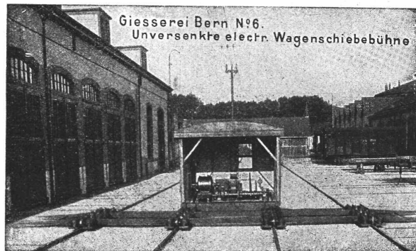
Giesserei Bern No. 6. Unversenkte electr. Wagenschiebebühne