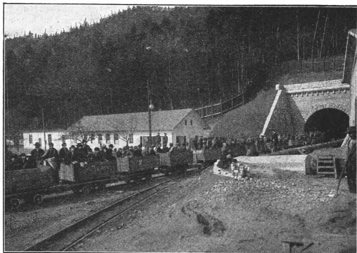
Südportal des Hauenstein-Basis-Tunnels.

Fabrikation und Lieferung von kompletten Tiefbohrreinrichtungen, kombinierten Kernbohrmaschinen für Diamantkrone, Stahlkrone oder Stahlschrot.