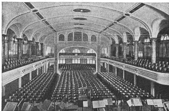
Tonhalle St. Gallen — Möbliert 1909

Ingenieur , älterer, akad. geb., mit vielseitiger Erfahrung in Bahn- und Brückenbau sowie in Betrieb, wünscht leitende Stelle. (55)