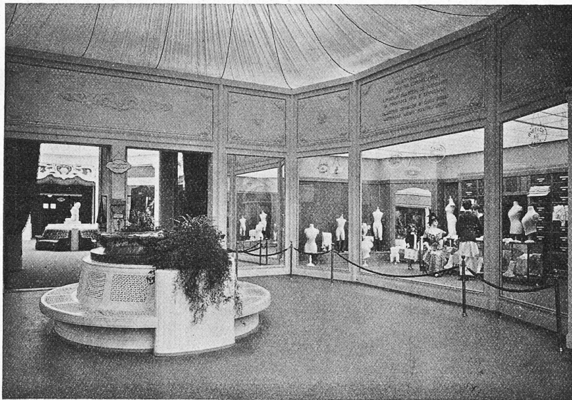
Abb. 9. Kollektiv-Ausstellung der Fein- und Exportstricker. — Arch. Streiff & Schindler, Zürich.