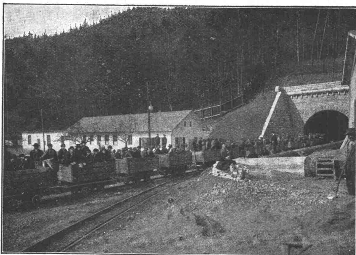
Südportal des Hauenstein-Basis-Tunnels.

NB. Handelsketten nur durch Eisenhandlungen zu beziehen.