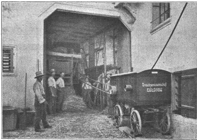
Dreschmaschinenantrieb mit Oerlikonmotor.