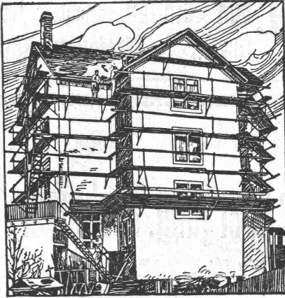
Schweizerische Landesausstellung 1914: 1 goldene und 2 silberne Medaillen.

Das Ideal aller Gerüste (ohne Stangen) ist das