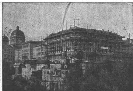
Hotel Bellevue-Palace Bern in Bern. Generalansicht.

Fundationen Brückenbau Wasserbauten Reservoirs, Silos Massivdecken nach eigenen bewährten Systemen Hochbauten aller Art