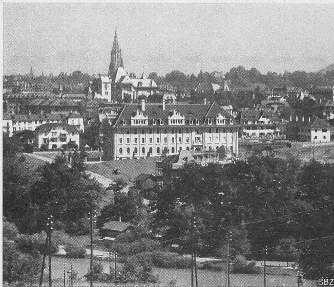
Abb. 1. Ansicht der Südfront von der Wabernstrasse aus.

Mit Bezug auf die Prüfung von gewöhnlichen Längen- und Hohlmassen, Gewichten und Wagen ist, um einer irrtümlichen Auffassung über die Tätigkeit des Instituts vorzubeugen, zu bemerken, dass sich das Amt mit der Prüfung gewöhnlicher Längen- und Hohlmasse, Gewichte und Wagen des Verkehrs nur insoweit befasst, als es sich um die Zulassung von Systemen handelt. Das Bundesgesetz scheidet klar und scharf das Arbeitsfeld des Schweizerischen Amtes von den Befugnissen und dem Tätigkeitsgebiet der kantonalen Eichstätten. Die letztern haben nur die Eichung der gewöhnlichen in Handel und Verkehr vorkommenden Längen- und Hohlmasse, Gewichte und Wagen vorzunehmen, während dem Schweiz. Amt für Mass und Gewicht und seinen Hilfsprüfämtern die obligatorische Eichung, bezw. fakultative Prüfung und Beglaubigung von allen Präzisions-Längen- und Hohlmassen, Wagen und Gewichten, sowie der elektrischen Messinstrumente, Gasmesser,