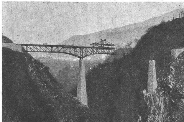
Pont-route sur la Breggia, entre Castello et Morbio-Superiore (Tessin), construit en 1912. Longueur 110 m.