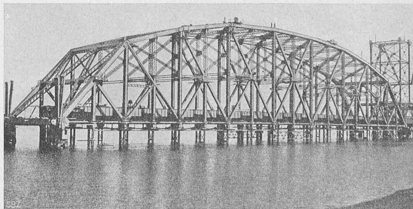
Einhängender Mittelträger der Quebec-Brücke, auf dem Montagegerüst (Nach „Eng. News“ v. 24. Aug. 1916).