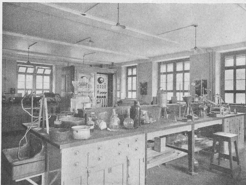
Abb. 16. Physikalisch-chemisches Unterrichts-Laboratorium.